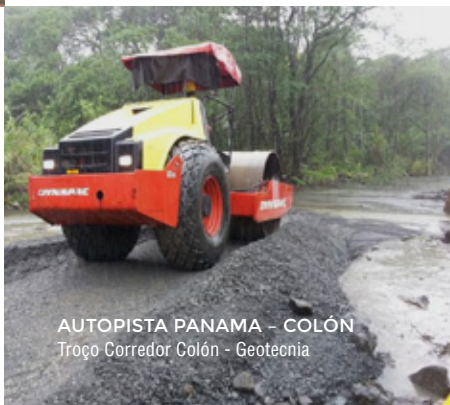
AUTOPISTA PANAMA - COLÓN Troço Corredor Colón - Geotecnia

Túneis, poços, estações subterrâneas, contenções e fundações especiais. No âmbito da Geologia-geotecnia tem capacidade para elaborar estudos de Geotermia de Baixa Entalpia para climatização de edifícios.