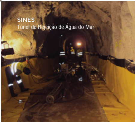
SINES Túnel de Rejeição de Água do Mar

Túneis hidráulicos, reservatórios, barragens, desde mini-hídricas ou pequenas barragens colinares, a grandes aproveitamentos hidroeléctricos, passando pelo domínio da auscultação e instrumentação de obras.