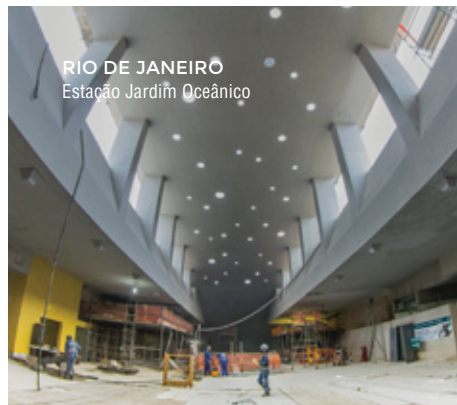
RIO DE JANEIRO Estação Jardim Oceânico

As obras de arte (pontes, viadutos, obras de arte correntes e outras estruturas de atravessamento rodoviário, ferroviário e pedonal) são uma das principais vocações da NSE. Para além da produção de projecto, desenvolve também estudos especiais dinâmicos, de interacção solo / estrutura e estrutura / via / veículo.