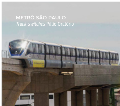
METRÔ SÃO PAULO Track-switches Pátio Oratório