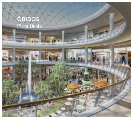
ÓBIDOS Plaza Oeste

Complexos intermodais, estações e outras estruturas associadas a vias rodoviárias e ferroviárias. Projectos integrados, envolvendo técnicos das diversas áreas de engenharia e arquitectura.