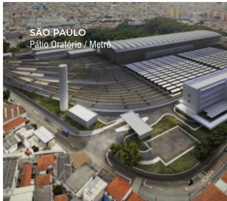
SÃO PAULO Pátio Oratório / Metrô

Obras de urbanização, integração urbana e paisagística, arranjos exteriores, redes viárias de adução de água, drenagem e saneamento.